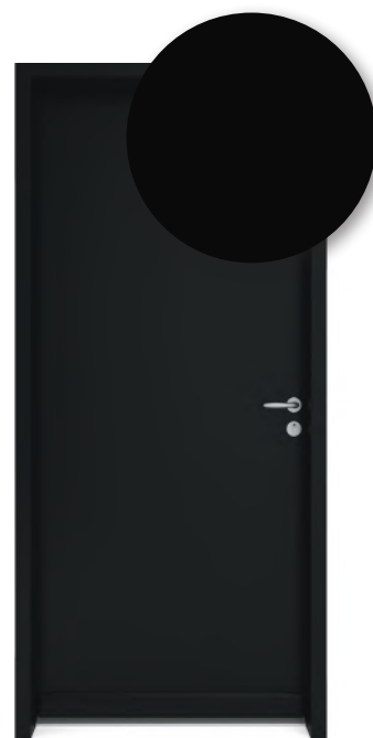
NOIR RAL 9005

► Les blocs-portes métalliques techniques (PMT / PMIS) sont disponibles dans les coloris laqués ci-dessus (teinte avec 30% de brillance).