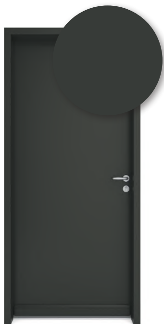
GRIS TERRE D'OMBRE RAL 7022