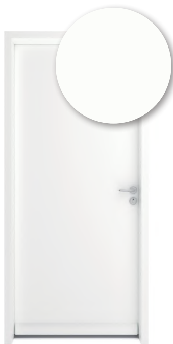
BLANC PUR RAL 9010