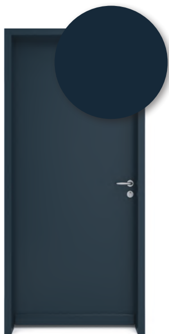
BLEU ARDOISE RAL 5008