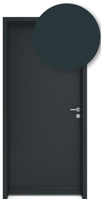
GRIS ANTHRACITE RAL 7016