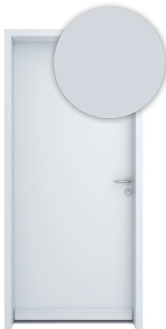
GRIS CLAIR RAL 7035