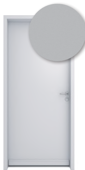
GRIS ARGENT MÉTAL RAL 9006